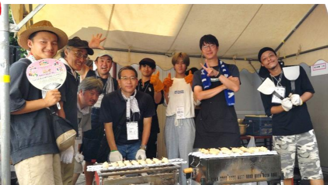
暑さに負けず、笑顔でフル回転！焼き鳥も焼きそばも、みんなで交代しながら準備中！笑顔と香ばしい香りが広がる、夜店準備のにぎやかなひとときです！