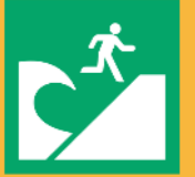
JIS Z 8210_6.1.6 津波避難場所

津波から避難するための場所で、横浜市では小学校・駅・区役所などに加え、複数の民間施設とも協定を結び、津波避難施設として指定しています。