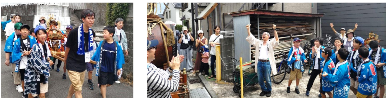
やりきったぞ！子ども神輿と山車巡行、大成功！町内を一周して、みんなで力を合わせてかつぎきった子ども神輿。汗と笑顔が輝く、達成感いっぱいの瞬間です！