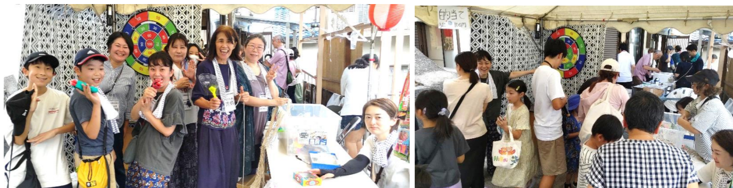
笑顔いっぱい！ゲームで大盛り上がり！子どもたちが夢中になって遊ぶ姿に、夏祭りの楽しさがギュッと詰まっています！