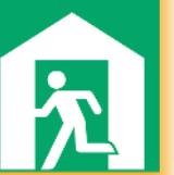
JIS Z 8210_6.1.5 避難所(建物)

避難場所は横浜市のホームページで確認できますので、ご自宅や職場、よく行く場所の近くにある避難場所を事前に把握しておきましょう。大切な命を守るため、早めの避難を心がけましょう! (防災部)