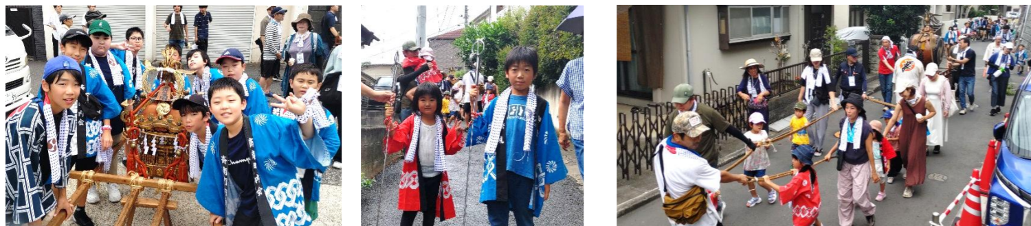
子ども神輿、笑顔満開！小さな手で一生懸命がついで、元気いっぱいに町を練り歩く子どもたち。笑顔と声が響き渡り、見ているだけで元気をもらえるひとときです！