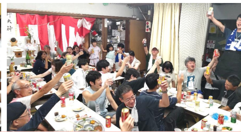
夜店は大にぎわい！行列ができるほどの大盛況！笑顔とおいしい香りがあふれる夏の日。そして最後は、がんばったスタッフみんなで乾杯！最高の一日を締めくくる、最高の瞬間です！