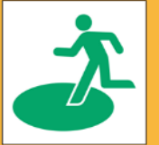
JIS Z 8210_6.1.4 広域避難場所

大規模火災時に、輻射熱や煙から身を守るための避難場所です。斎藤分町の指定避難場所は「神奈川大学」ですが、火災の場所や風向きによっては危険な場合もあるため、状況に応じて他の広域避難場所への避難も検討してください。