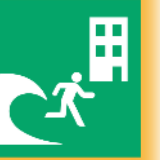
JIS Z 8210_6.1.7 津波避難ビル