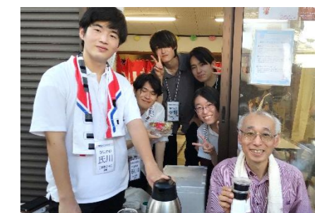
神奈川大学のコーヒークラブやコーヒー交番のコーヒーゼリーが登場！本格派の味と元気な笑顔で、夏祭りの楽しさがさらにアップ！夏祭りをもっと熱く、もっと美味しく盛り上げてくれました！