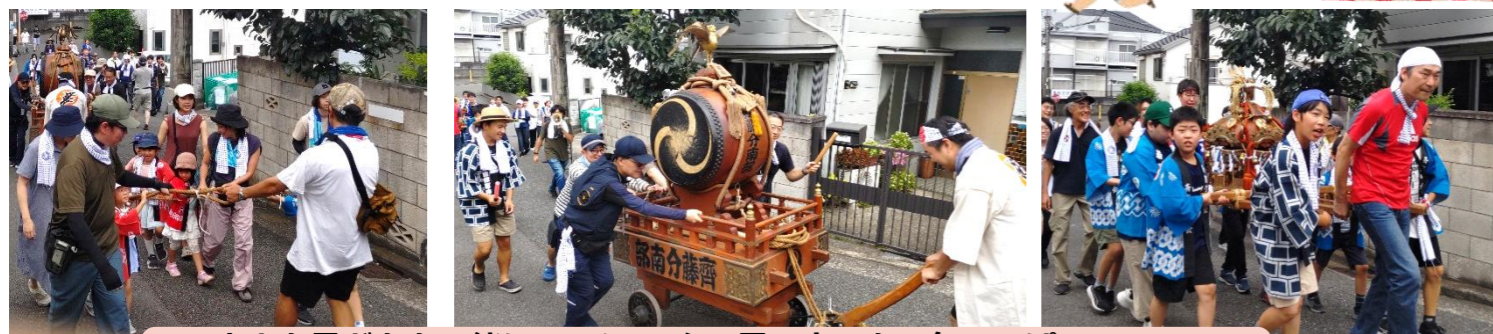
大人も子どもと一緒にワッショイ！暑い中でも元気いっぱい！町内を盛り上げる山車や子ども神輿がにぎやかに練り歩いています！