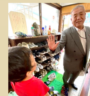
大人も子どもも、おしゃべりしながら笑顔が広がるカフェですね! おいしい飲み物と楽しい 会話で、地域のつながりが自然と深まっていく様子がよくわかります!! (9月より)