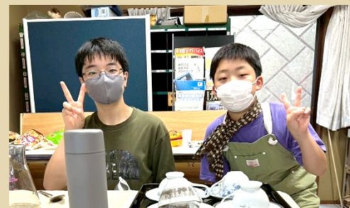
亮太子ども店長が丁寧に淹れる一杯のコーヒーに、大人たちも思わず笑顔に! 子ども店長・ 副店長がいることで、カフェの空気がふわっとあたたかくなりますね! (9月より)