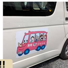
地域の買い物バスで笑顔満タン! バスで繋がる地域の輪!!